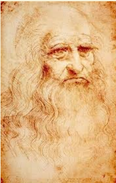
Leonardo da Vinci, Autoritratto , 1515 ca., Torino, Biblioteca Reale